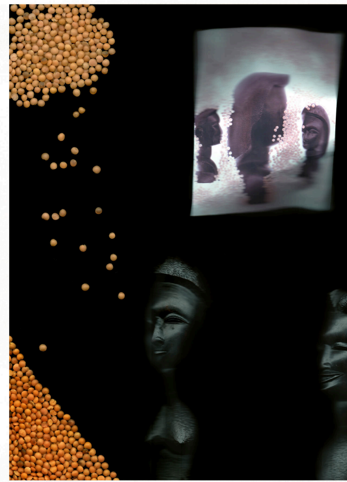
Os Baptistas II, 55 x 40 cm, Scanogramm, Archival Pigment Print auf Aludibond, 2015