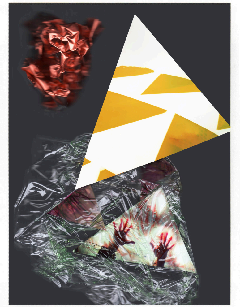
The Jinx, 55 x 40 cm, Scanogramm, Archival Pigment Print auf Aludibond, 2015