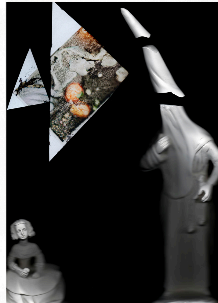
Menina, 55 x 40 cm, Scanogramm, Archival Pigment Print auf Aludibond, 2016